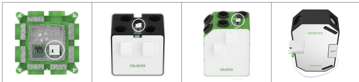
DucoBox Silent (Connect) / Focus / Hygro (Plus) / Silent FR